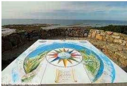
Table d'orientation avec une vue panoramique de l'estuaire du Jaudy à Bréhat.

Creac'h maout , tertre de 41m d'altitudes avec des ruines du sémaphore (haut lieu de la résistance en août 1944).